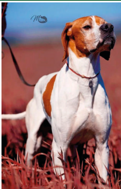
PATRIOT OD BUKOVICE