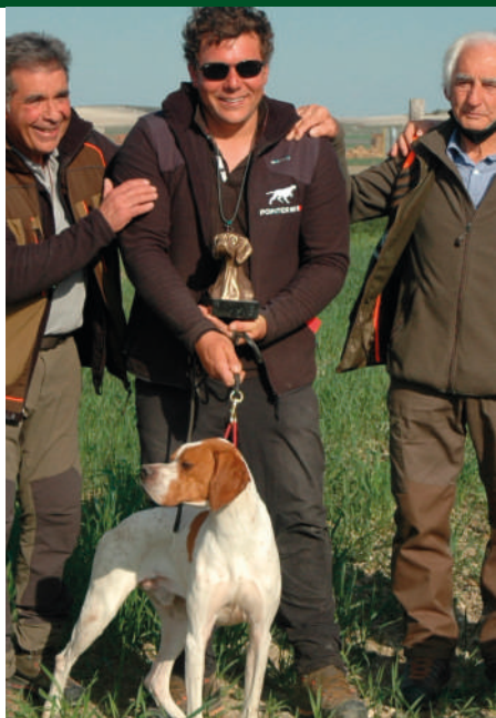
NOLO DE SYMPHONIE