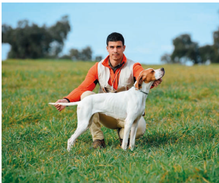
PIKTA DU GOURE