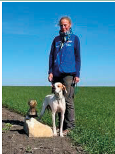
ONJA WON DE POSTWAIGE